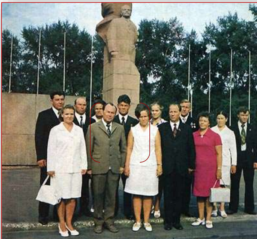
На фото: Депутаты Верховного Совета СССР 9 созыва (избран 16.06.1974)